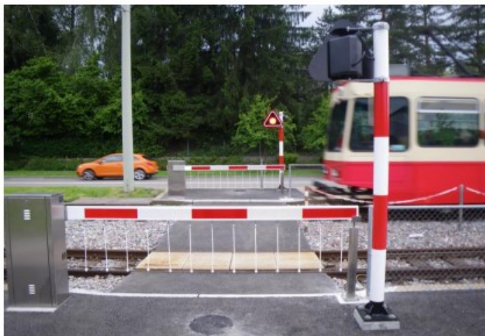
Bahnübergang Geeren der Forchbahn in Zollikerberg

Bereits sind über 250 Anlagen quer durch die Schweiz realisiert.