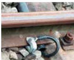
Kontaktklemmen und Schienenverbinder