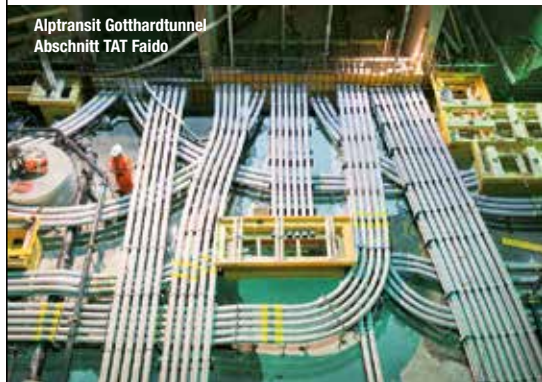
Alptransit Gotthardtunnel Abschnitt TAT Faido

Spezialbogen für den Kabelschutz! Coudes spéciaux pour la protection des câbles!