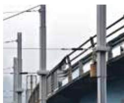
Lieferung und Montage von Berührungs- und Vogelschutzprodukten