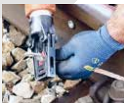
Erstellen von Stromrückleitungen und Erdungen