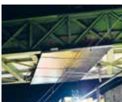
Lieferung und Montage von Hochspannungsisolationen