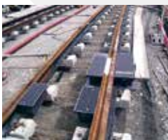
Lieferung und Montage von Gleisanschlusskästen