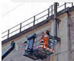
Erstellen von Schwerbefestigungen